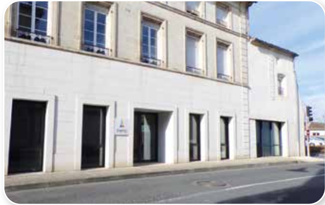
Les locaux actuels de TREMA seront occupés par le Centre Médico-Psychologique

Dans le précédent bulletin municipal, il avait été indiqué que la Communauté de Communes allait examiner la demande de locaux supplémentaires du Centre Médico-Psychologique de Gémozac (service du Centre Hospitalier de Jonzac) en utilisant une partie des bâtiments qui appartiennent à la commune en face du Pôle Santé.