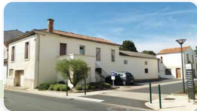
TREMA rejoindra la rue Foch

L'association TREMA (soins infirmiers à domicile et équipe spécialisée Alzheimer) se retrouve également à l'étroit dans les bureaux qu'elle loue à la commune. Elle souhaite aussi accueillir le service d'éducation spéciale et de soins à domicile pour des enfants déficients visuels, auditifs ou souffrant de dysphasie domiciliés dans la partie sud du département.